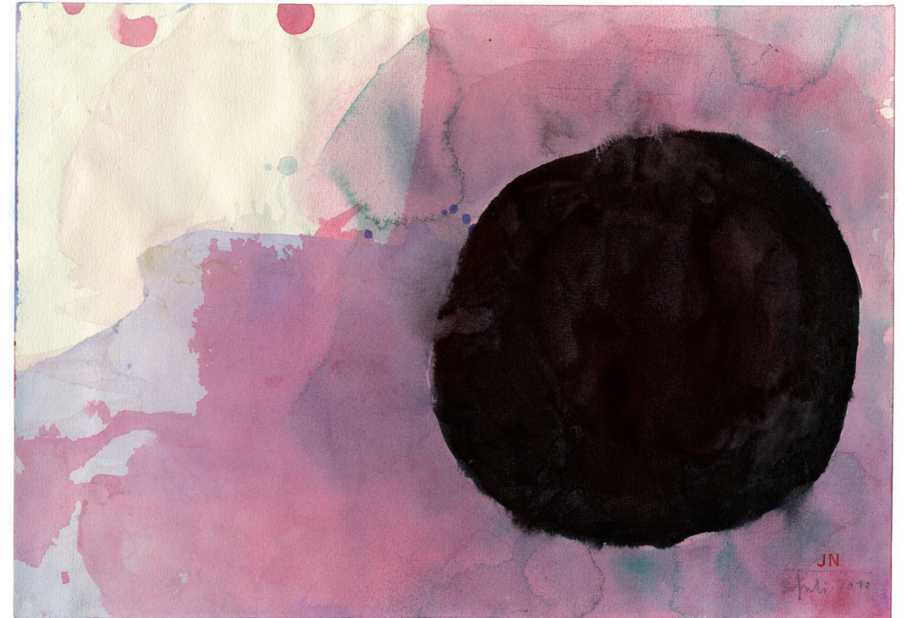
O 2010, Tempera auf Papier, 20,8 x 29,5 cm