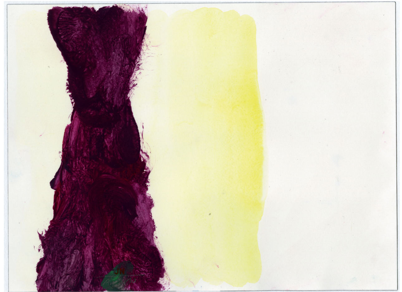
Paar 2010, Tempera auf Papier, 23,1 cm x 31 cm (Privatbesitz)