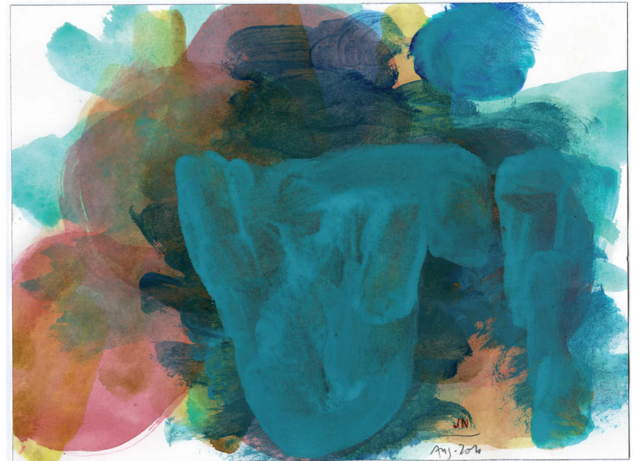
ist bereit (für die Einsenkung) 2010, Tempera auf Papier, 23 cm x 31 cm