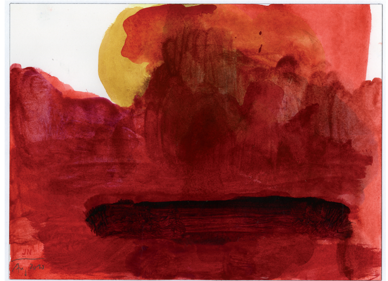
Altar (abends) 2010, Tempera auf Papier, 23,1 cm x 31 cm