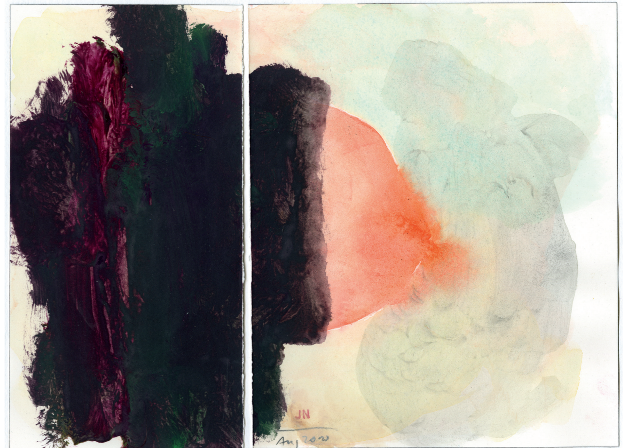
Einlass (Paar) / Öffnung / Entscheidung 2010, Tempera auf Papier, 23,1 cm x 31 cm (Privatbesitz)

so ist die Nähe nah und entfernt sich und ist es doch noch immer: nah; fühlt sich nur etwas anders an – ausserhalb – weil sie wünscht, wieder Eins zu werden; um – sich gefunden –, verloren in diesem Eins-Sein, nicht mehr wahrzunehmen; und entgeht sich ohne Unterlass im Wunsch zu fühlen und sich erneut neu wieder zu finden, um ineinander sein zu dürfen.